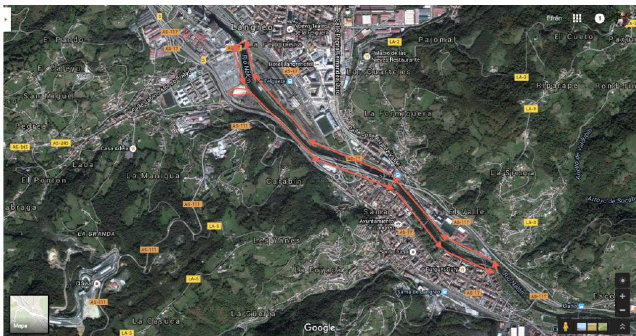
Plano del recorrido de la prueba.

La prueba de cinco kilómetros ( POR ASFALTO ) con salida y meta en los alrededores de la pista de atletismo de Lada, discurrirá casi íntegramente por el paseo que discurre paralelo al río Nalón. Los corredores se dirigirán hacia Sama por el dicho paseo llegando al puente de hierro. Seguirán por el Parque de Sama hasta el Adaro donde cruzarán el puente de la Montera para regresar a Lada por la otra orilla. Otra vez el cruce del puente de hierro, donde la sidrería La Mula Torna. Siguiendo ya todo el paseo hasta el puente de Lada, en dirección a la Pista de Lada donde para terminar en el mismo punto de salida. Puede sufrir modificaciones por motivos organizativos, siempre manteniendo la misma distancia.